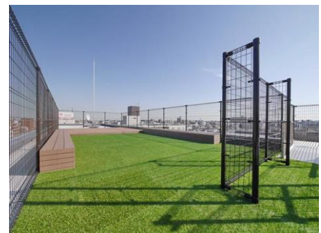
屋上に設置されているドッグラン

少子高齢化による人口減少によって、賃貸需要が低下し空室率が高まり、不動産投資は難しい状態になるのではとされている中で、当社は99.0%（平成30年3月末現在）と高い入居率を誇っています。高い入居率を誇る要因は、お客様のニーズを徹底的に研究し「あると便利だ」と思った物を設備に投入しています。自社開発部門が立ち上がったことから、不動産投資物件では珍しい床暖房、エントランスへの水素水サーバー、屋上にドッグラン、浴